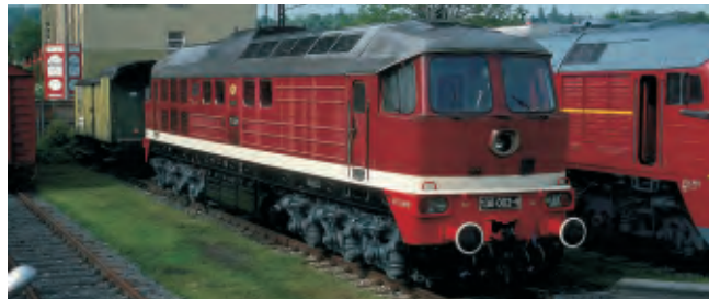
Vorbildfoto – Betriebsnummer kann abweichen!

Diesellokomotive, Baureihe 130 der DR, Betriebsnummer 130 005-2