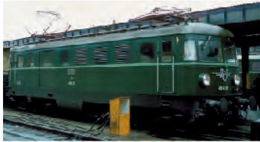
Vorbildfoto – Betriebsnummer kann abweichen!

Elektrolokomotive, Reihe 4061 der ÖBB, 1. Bauserie, grün