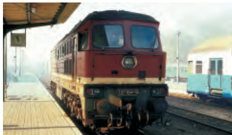
Vorbildfoto – Betriebsnummer kann abweichen!

Diesellokomotive, Baureihe 131.1 der DR, Betriebsnummer 131 158-8