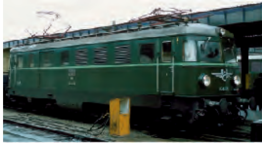
Vorbildfoto – Betriebsnummer kann abweichen!

Elektrolokomotive, Reihe 1046 der ÖBB, 1. Bauserie, grün, mit altem ÖBB Logo