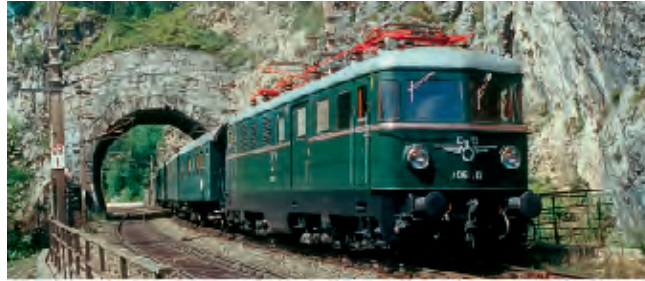
Vorbildfoto – Betriebsnummer kann abweichen!

Elektrolokomotive, Reihe 4061 der ÖBB, 2. Bauserie, grün