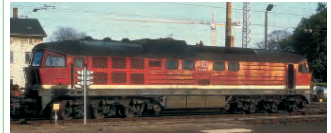
Vorbildfoto – Betriebsnummer kann abweichen!

Diesellokomotive, Baureihe 231 der DB AG, Betriebsnummer 231 040-7